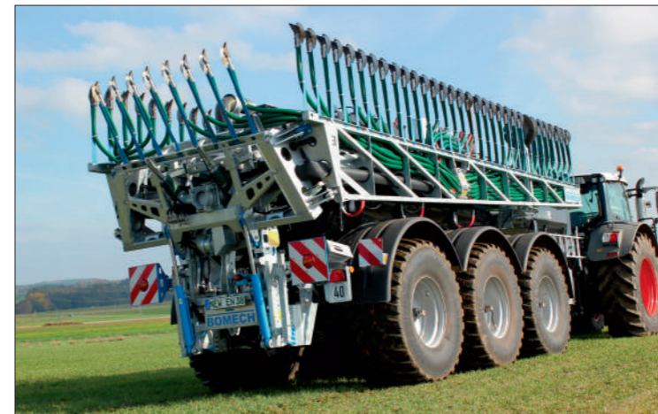
Seht kompakte Transportstellung

Technische Daten sind unverbindlich. Änderungen Vorbehalten.